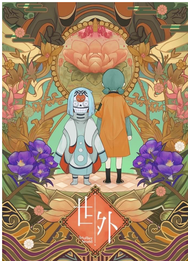
図6: 短編「世外 Another World」ティーザーポスター