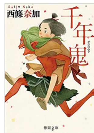
図4：徳間書店『千年鬼』（西條奈加：著）

2017年6月に香港の独立系プロデューサーであるポリー・ユン氏が来日、ロングシノプシスを作成した『千年鬼』の映像化（当時はネットドラマ）の検討をしたいとオファーが入った。